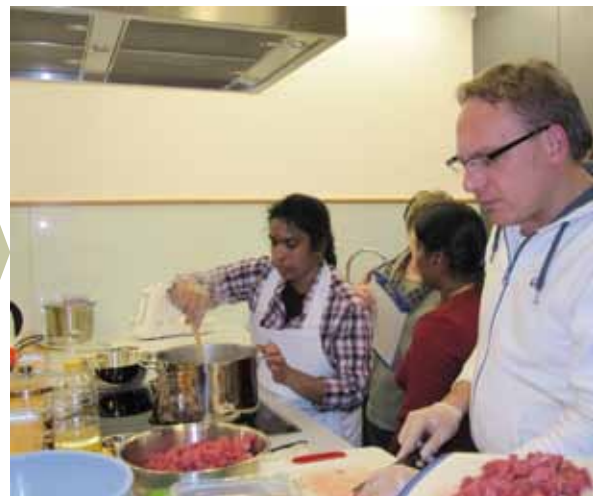
Cocina cultural de Aalen – Encuentro culinario en equipo

La cooperación internacional funciona especialmente bien si las personas pueden construir y diseñar algo juntas y, a través de su trabajo conjunto, tanto transmitir su propia cultura como desarrollar entendimiento hacia las demás. Actividades de acceso sencillo, como la cocina o jardinería conjuntas, facilitan la integración y abren la puerta a otras actividades.