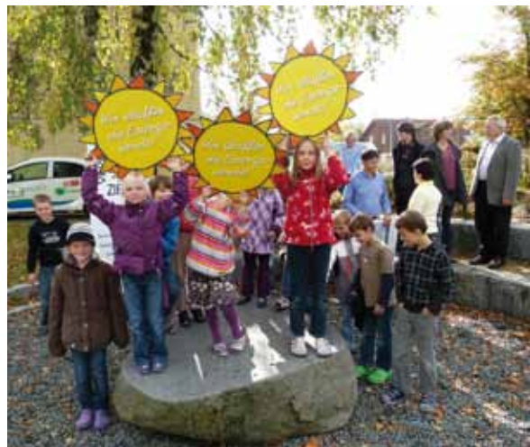
Proyecto escolar para la transición energética en el distrito de Fürstenfeldbruck – los niños se implican activamente

Por lo tanto, en Alemania, el Consejo Asesor sobre el Cambio Climático (WBGU) ha propuesto un nuevo “contrato social para una gran transformación”. Esta “gran transformación” se llevará a cabo y se sentirá especialmente en ciudades. En ellas, por un lado, el consumo y las emisiones son especialmente elevadas y, por otro, se dispone de numerosos potenciales de diseño y transformación (véase WBGU “Un mundo en transición. Contrato social para una gran transformación”, Berlín 2011).