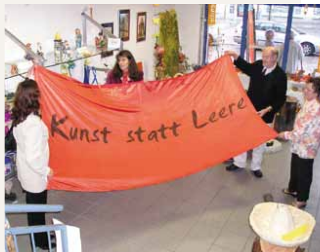
Inauguración de la exposición “Arte en vez de vacío” del 2008