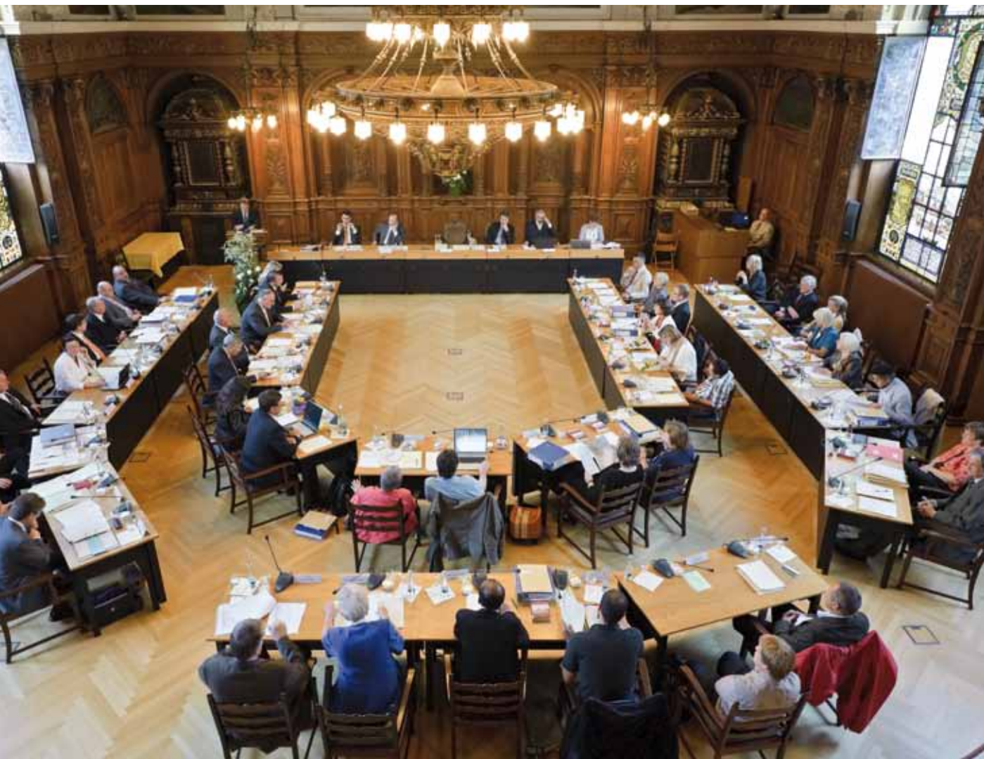
Reunión del consistorio de Heidelberg