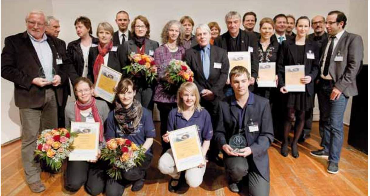
Ganadores del premio ZeitzeicheN del 2011 durante el 5º Congreso Netzwer21 en Hannover

La convocatoria en varias categorías invita también a municipios medianos y pequeños a participar y a que valoren la posibilidad de establecer un compromiso durante años.