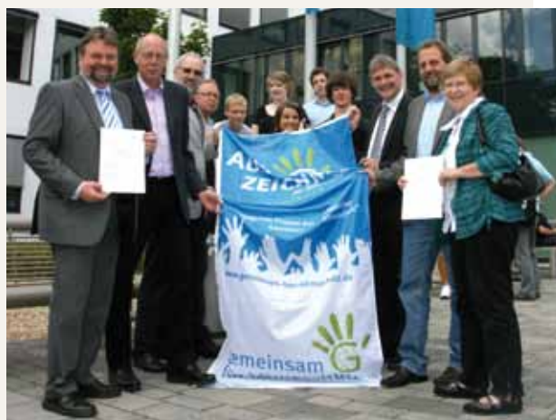
Entrega de la bandera para la protección del clima como parte de la campaña “Juntos por la protección del clima” por parte del LAG 21 NRW y la Alianza local del Clima del distrito de Unna en el Instituto Barlach y en la Escuela de Formación Profesional de Werne

El congreso está patrocinado por el Ministerio Federal de Medio Ambiente, la Oficina Federal de Medio Ambiente, los municipios anfitriones, así como numerosos patrocinadores y personal voluntario. (Véase www.netzwerk21kongress.de ).