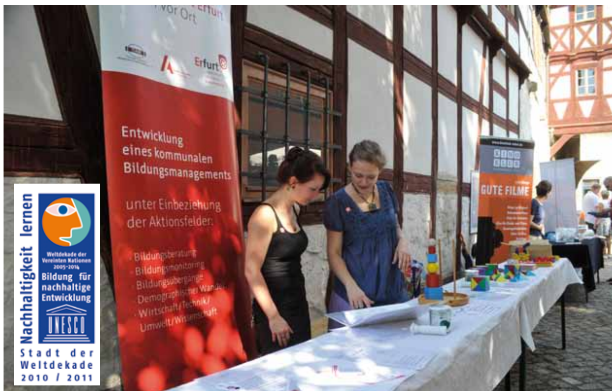
Festival de Erfurt 2011: la ciudad se presenta como emplazamiento educativo