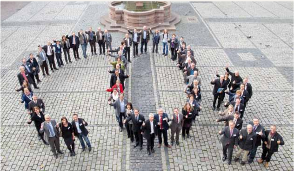
Convención de alcaldes – Fundación del club “Convenio de los Alcaldes” alemán en 2011 en Heidelberg