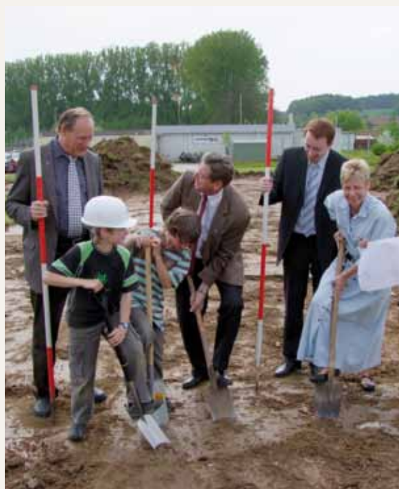
Palada para la construcción del espacio multifuncional