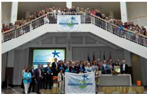
Firma de la “Carta Magna Ruhr.2010” contra la explotación infantil el 12 de junio de 2010 en el Ayuntamiento de Dortmund

La adquisición sostenible y el comercio justo están estrechamente vinculados. Con ayuda de acuerdos municipales y las relaciones públicas relacionadas, ambos temas pueden unirse bien. Así, ciudades y municipios pueden contar con una buena credibilidad para promover un cambio de comportamiento del consumidor también en el ámbito privado.