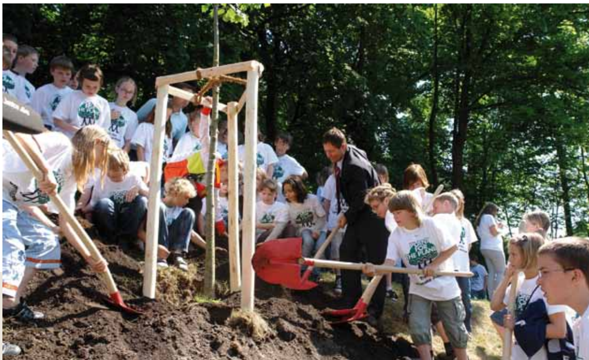
En el marco de la "Academia Plant-for-the-Planet", en Neumarkt, 80 niños plantan árboles con el alcalde en el parque de la ciudad sentando un precedente para una mayor justicia climática

La sostenibilidad sólo puede ser eficaz si la instauran las personas in situ. Para ello, los municipios resultan ser importantes espacios de experimentación. Esto también incluye el apoyo a procesos participativos y conceder el reconocimiento y la distinción a los actores.