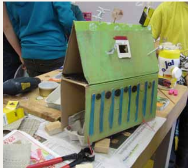
Niños de primaria construyen su modelo de ciudad del futuro en el taller “Acabemos con los embalajes engañosos”

A través de intercambios se consiguen efectos sinérgicos similares entre políticas medioambientales y sociales. En muchas ciudades, por ejemplo, se han creado casas sociales que recogen bienes usados y en buen estado y las entregan de manera gratuita a