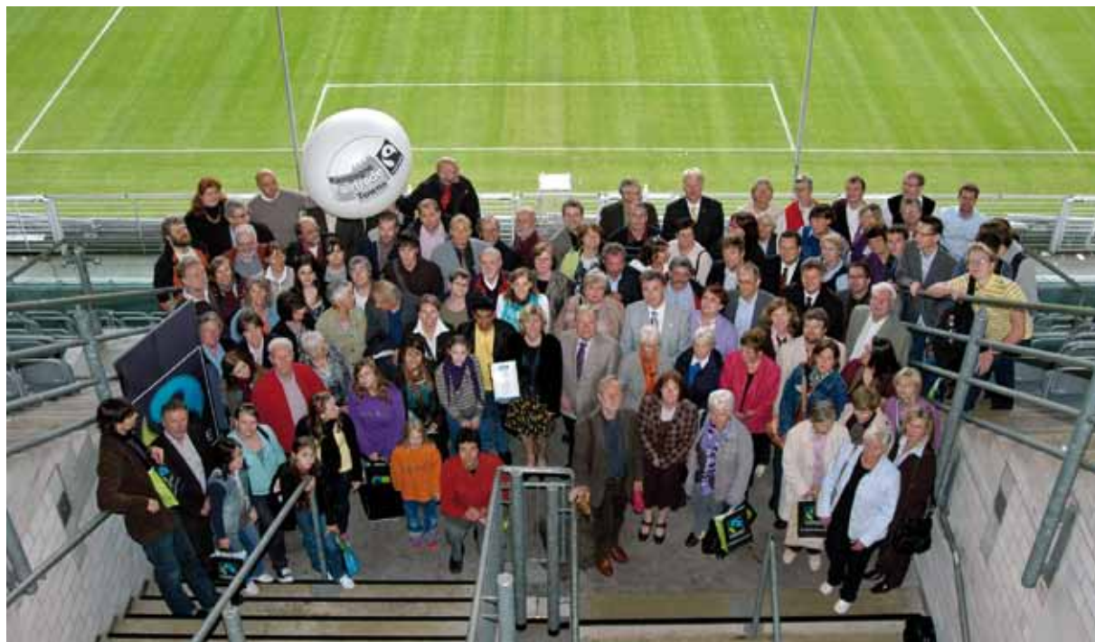
Entrega del premio Comercio justo a la ciudad de Dortmund en 2009 en Signal Iduna Park

Los municipios pueden convertirse en un ejemplo para los consumidores en el ámbito de las adquisiciones públicas, por ejemplo, si utilizan electricidad ecológica, sanean ecológicamente sus edificios, utilizan dispositivos de energías renovables en sus oficinas u ofrecen productos regionales, ecológicos y justos en sus cafeterías.