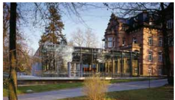
Restaurante de la Academia Evangélica de Bad Boll

Las instituciones eclesiásticas que han organizado sus compras en base a criterios ecológicos y sociales, a menudo introducen también un sistema integrado de gestión medioambiental, consiguiendo así efectos positivos: reducen la carga medioambiental y reducen costes. Así, algunas instituciones eclesiásticas se convierten en gestores importantes. La Academia Evangélica de Bad Boll, con su compromiso con la región, gana productores in situ para la producción de alimentos ecológicos, consiguiendo así una cadena de valor ecológica estable.