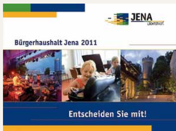
Portada del presupuesto participativo de 2011 de Jena