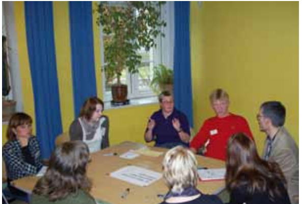
Presentación "Presupuestos participativos – Experiencias y perspectivas" en Weimar en 2011

Por lo general, en la realización de un presupuesto participativo sólo influyen las aportaciones voluntarias e un municipio. En los presupuestos muni-