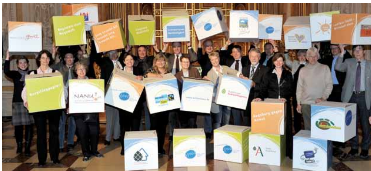
“Bloques” de la Agenda de la ciudad de Augsburgo

Imitar este modelo es posible y, además, merece la pena – para la generación presente y para las futuras. ■