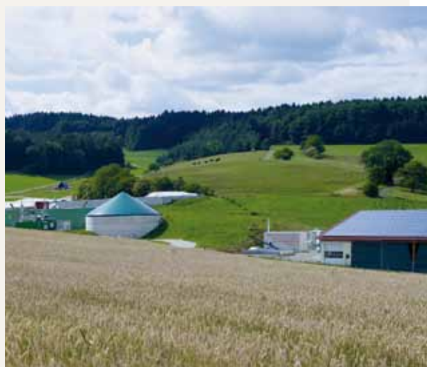
Planta fotovoltaica y de biogás con central térmica de calefacción en bloque en Mauenheim, primer pueblo bioenergético en Baden-Württemberg

En ciudades y municipios, la instalación de parques eólicos o plantas de biogás, así como otros grandes proyectos de construcción, pueden enfrentarse a la oposición de la población. En la práctica, se ha demostrado que la pronta participación de la población desde la fase de planificación consigue crear un ambiente constructivo de debate, pudiendo contribuir también a la solución de conflicto de intereses. Para ello, existen numerosos procedimientos. Un resultado de la planificación conjunta puede ser, por ejemplo, una empresa ciudadana propia o un “molino ciudadano”, financiado por los habitantes y comerciantes locales y cuyos beneficios permanezcan en la región y regresen a los inversores locales. ■