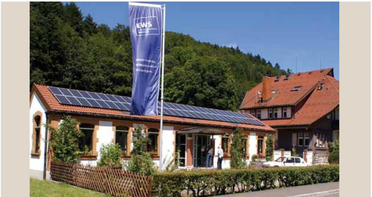
Oficinas de las Centrales Eléctricas de Schönau (EWS)