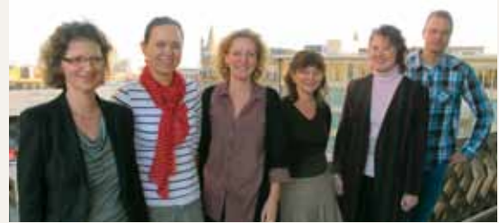
Equipo del proyecto “Comprar futuro” en el Instituto para la Iglesia y la Sociedad de la Iglesia Evangélica de Westfalia

La introducción de una administración de compras sostenible se consigue con el apoyo, paso a paso, del equipo asesor. Tras un análisis