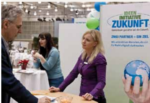
“Ideas para un futuro emprendedor” se presenta en el 5º Congreso 21 en Hannover

Este modelo también se transmite a los clientes de dm: pueden comenzar a utilizar electricidad verde, de manera sencilla y sin gastos adicionales, con los paquetes de iniciación de los proveedores alternativos EWS en la Selva Negra y LichtBlick en Hamburgo. Si cierran el contrato, los clientes reciben una tarjeta regalo de dm por valor de 50 euros. Desde la introducción de estos paquetes de iniciación en el 2011, 3.200 hogares alemanes se han pasado a la electricidad verde. www.projekte.ideen-initiative-zukunft.de