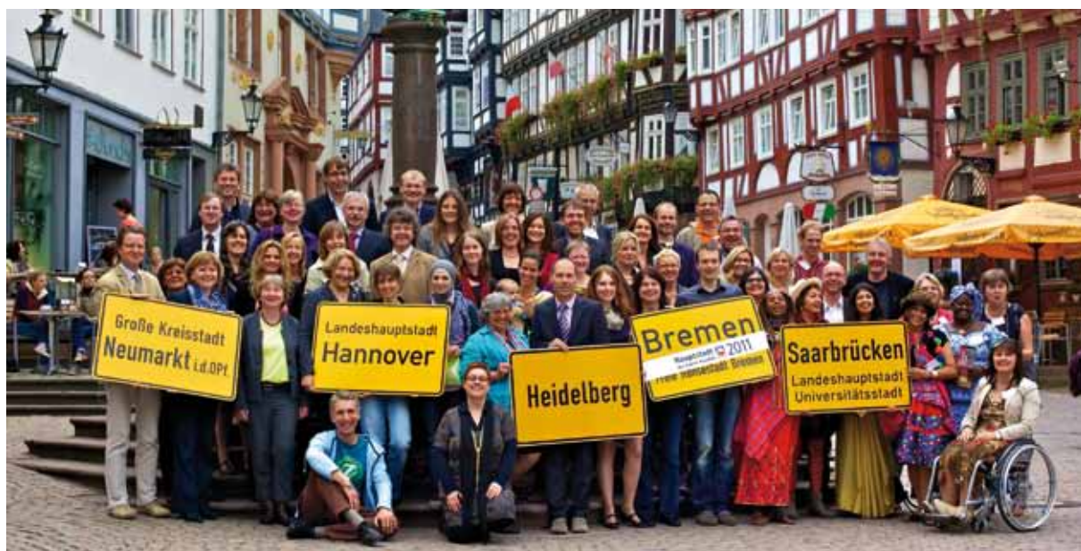
Ganadores del concurso "Capital del Comercio Justo" de 2011 en la ciudad de Marburg

Uno de los ganadores del 2011 es municipio de Bollewick, en el Estado federado de Mecklemburgo-Pomerania Occidental. Ha fundado una red de cooperación que allana el a menudo complicado camino hacia un pueblo bioenergético que ahorra CO 2 . Desde 2009, unos 68 municipios y distintas organizaciones ya han adoptado esta red. Dado que la red sigue creciendo, toda la región se ve beneficiada y la lucha contra el cambio climático se refuerza activamente.