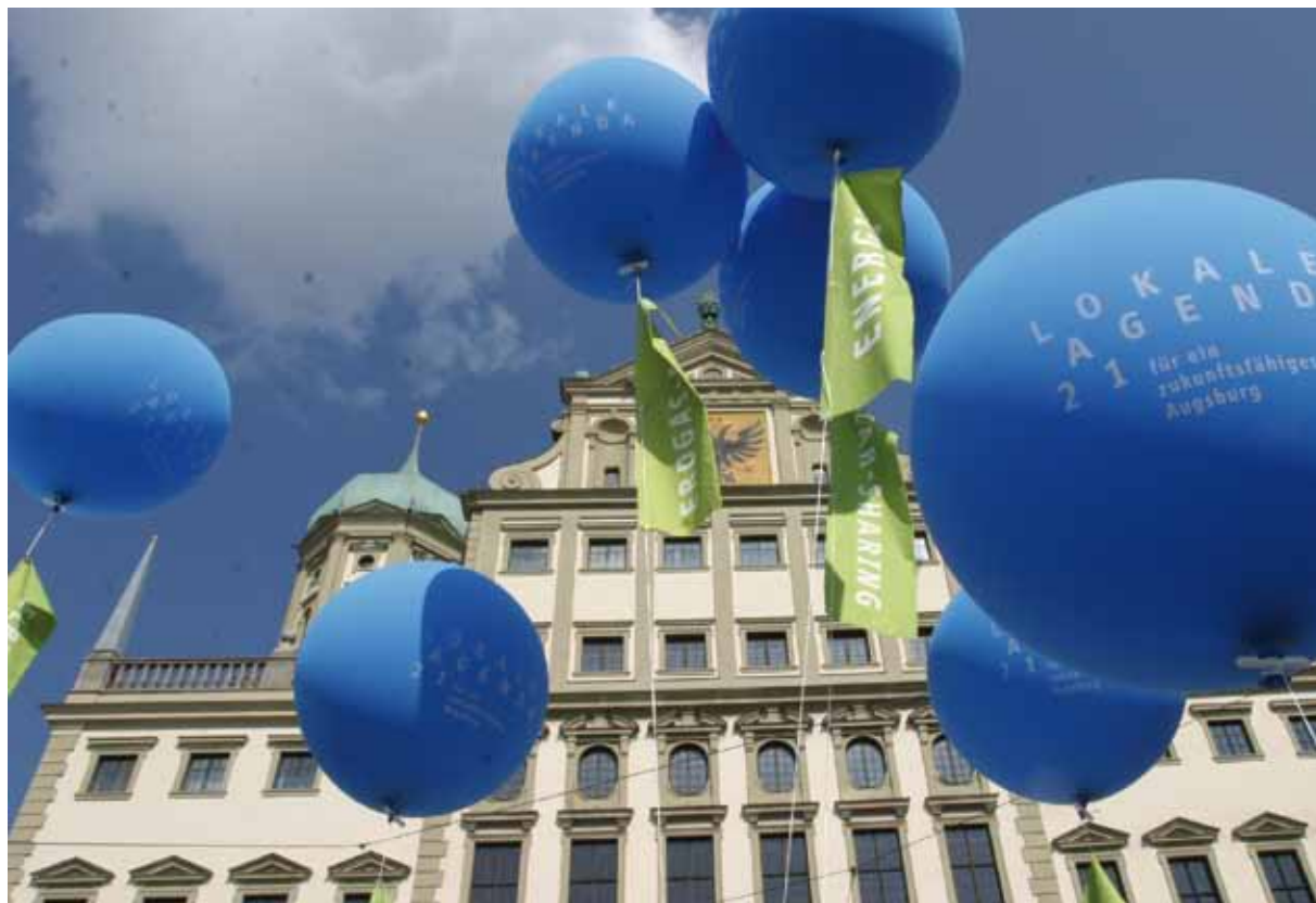
Acción de la Agenda en la plaza del Ayuntamiento de Augsburgo

Otra posibilidad de incluir la participación para el desarrollo y la implementación de objetivos de sostenibilidad también a nivel estratégico viene dado con la introducción de un examen de sostenibilidad de los proyectos del consejo. Este nuevo instrumento de política municipal de un examen de sostenibilidad se puso en marcha por la tendencia, tanto a nivel del Estado federado de Baden-Württemberg como en el gobierno federal y en el Bundestag, de realizar exámenes de sostenibilidad en el marco de las evaluaciones de impacto de leyes, y porque cada vez más municipios muestran su interés en este concepto. Debido a la importancia del control y evaluación para una reestructuración eficiente hacia la sostenibilidad, el examen de sostenibilidad será en el futuro un instrumento incluso más importante. ■