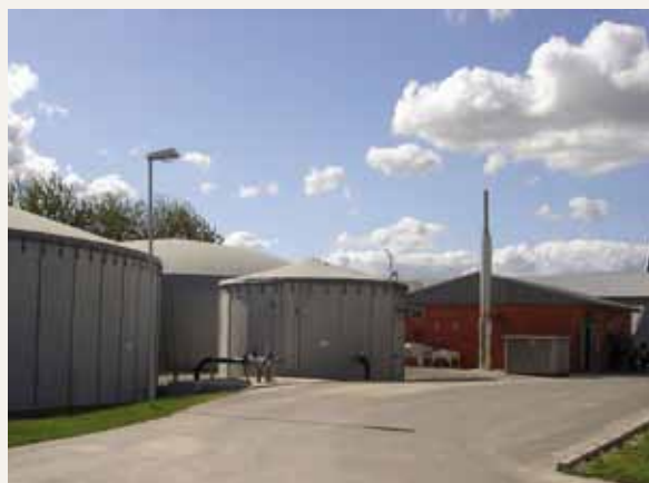
Planta de biogás en Feldheim