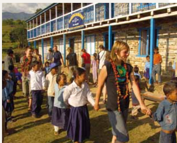
Alumnos de Gati y Freiberg juntos delante de la escuela