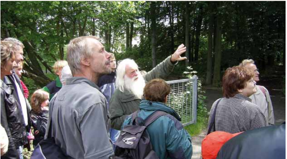
Recorrido por las áreas de referencia en el bosque de Crimmitschau con un guía

Con la certificación FSC del bosque se dan también otros efectos positivos. Así, los conocimientos obtenidos a largo plazo con este proyecto son muy interesantes para el estudio de los efectos del cambio climático, la conservación de la biodiversidad y la economía forestal del municipio. www.umweltzentrum-chemnitz.de