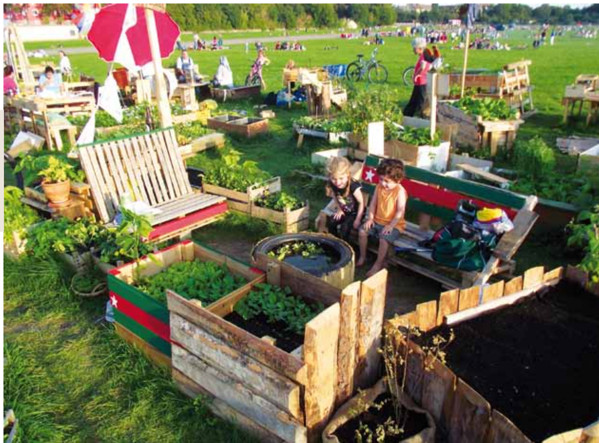
Diseño de jardines en Allmende-Kontor, Berlín