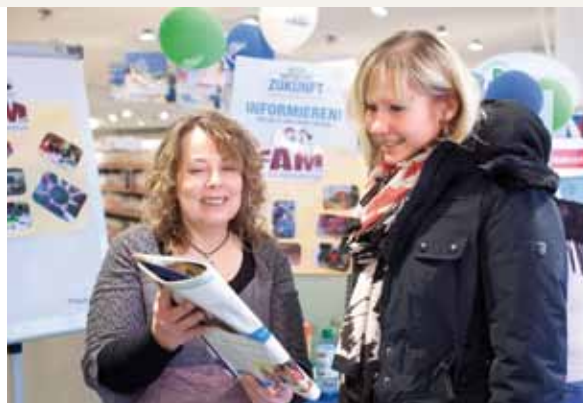
Presentación del proyecto “Punto de encuentro abierto” en la tienda de dm en Bretten, la representante del proyecto y una cliente de dm charlan sobre la edición especial de alverde