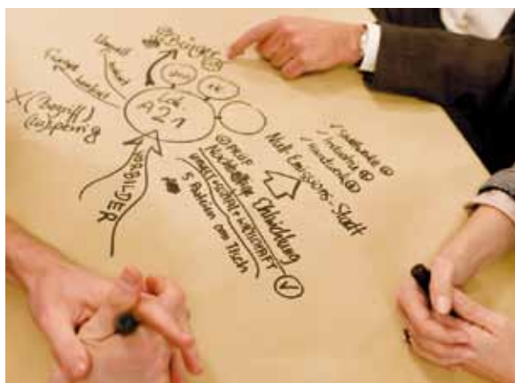
World-Café en el marco del 5º congreso Netzwerk21 en Hannover en 2011

En Alemania, los municipios se enfrentan a alguno de estos complejos problemas y las personas, así como los responsables de la toma de decisiones se dan cuenta in situ más a menudo de que no es posible una solución con las estrategias y recursos convencionales. Al mismo tiempo, sin embargo, los actores locales cuentan con experiencias y potencial que pueden utilizar activamente para tomar nuevos caminos y hacer frente a estos desafíos. Las experiencias prácticas muestran que en numerosas ciudades y municipios, las personas aprovechan las posibilidades in situ, abren paso a actividades de sostenibilidad y proyectos experimentales y, de este modo, también inician importantes procesos de aprendizaje. La activación del compromiso de la sociedad civil desempeña un papel importante, por ejemplo, a la hora de solucionar problemas sociales, en la cultura y la formación, así como en el ahorro de recursos y el uso de energías renovables.