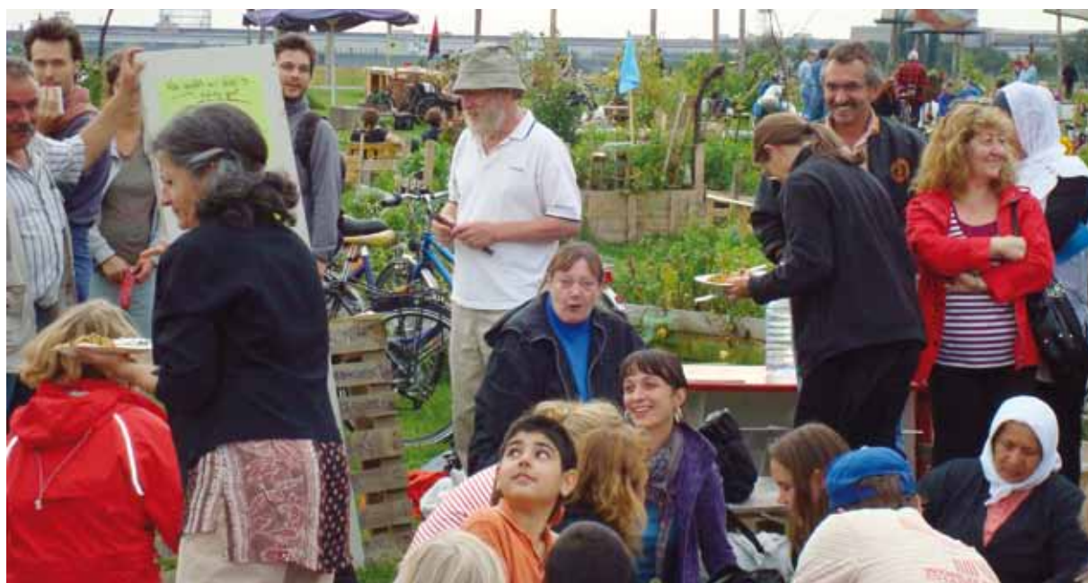
Pic-nic y planificación del terreno en "Allmende-Kontor", una superficie pionera en el antiguo aeropuerto de Tempelhof