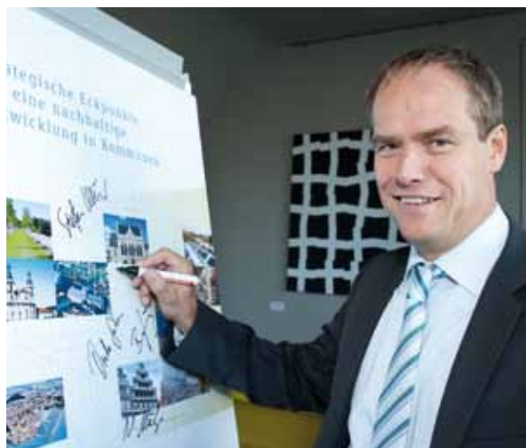
El alcalde de Heidelberg firma, en el Consejo para el Desarrollo Sostenible, las bases estratégicas para un desarrollo sostenible en el municipio

Bajo el título “se ha hecho mucho, queda más por hacer”, los municipios y actores locales en la “Declaración Río+20” se refieren al principio que dice que un desarrollo sostenible debe realizarse especialmente in situ y que las modificaciones profundas deben ser medibles. La reestructuración socioecológica necesaria en la economía y en la sociedad, sólo puede lograrse mediante los esfuerzos conjuntos de política, administración, economía y sociedad civil, donde estos esfuerzos deben intensificarse. Con vistas al cambio