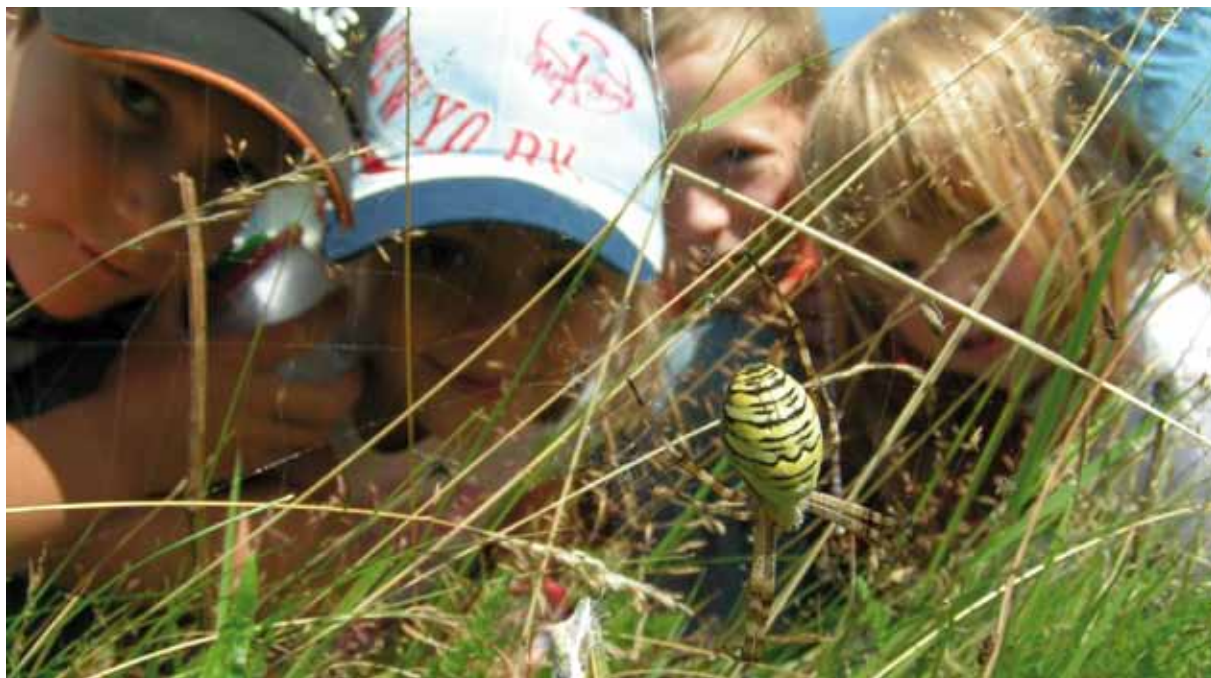
Niños en una excursión para explorar la naturaleza