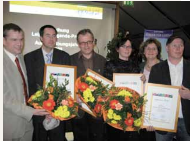
Entrega del premio Agenda de Leipzig en 2009

Para reconocer el gran compromiso de muchos actores locales y para mantenerlos en el tiempo, la ciudad concede todos los años el premio Agenda en varias categorías. El premio se entrega en cooperación con la compañía eléctrica Leipzig GmbH, VNG – Verbundnetz GAS AG, la Caja de Ahorros de Leipzig y la fundación “Ciudadanos por Leipzig”. Además del reconocimiento público, se incluye un premio en metálico que se utiliza por parte de iniciativas de la sociedad civil para la implementación de proyectos innovadores. Con el premio Agenda, también se fomenta en Leipzig la cooperación con inmigrantes. Así, en el año 2001,