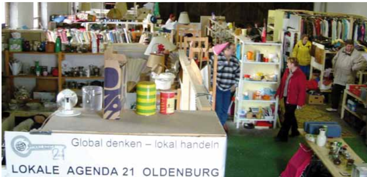
Mercadillo de Oldenburg