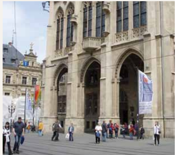
Ayuntamiento de Erfurt con banderas de “Educación para un desarrollo sostenible”

Erfurt tiene como objetivo convertirse en los próximos años en un centro educativo innovador y en un lugar de aprendizaje permanente. Un aspecto relacionado en el objetivo de establecer entornos educativos. A partir de un modelo educativo en el que esté incluido el desarrollo sostenible, se construyen piezas sucesivas del plan educati-