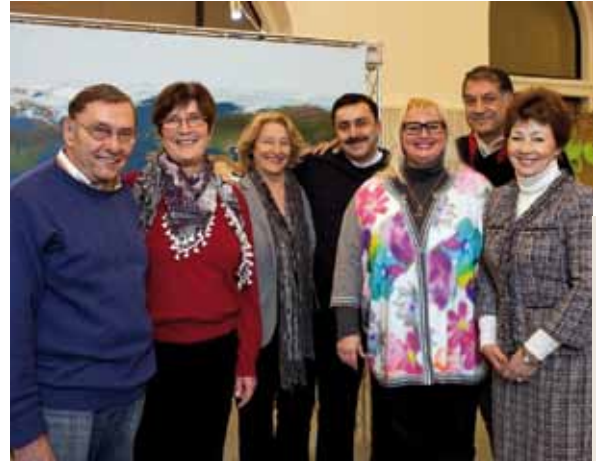
Los guías de integración reciben su cualificación como guías medioambientales en Hannover; La oficina Agenda 21 es socia de cooperación de la capital de Baja Sajonia.