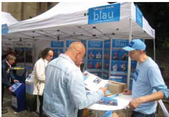
Stand de información sobre asesoramiento energético en Tübinga

En el cambio total de la producción energética hacia las energías renovables, los pequeños municipios de zonas rurales son a menudo importantes impulsores. Fundamentalmente tienen la ventaja de contar con estrechos contactos vecinales, relaciones emocionales con su lugar de origen y pueden discutir nuevas ideas en contacto interpersonal directo. Los conocimientos basados en la experiencia de estos innovadores son fundamentales para la transición energética y de demanda incluso a nivel internacional.