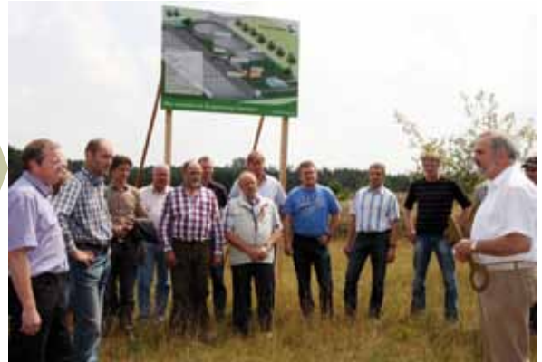
Entrega de llaves de las instalaciones de biogás en los terrenos de Saerbeck

Una estrategia global y coherente de transformación del sistema energético incluye numerosos instrumentos y conceptos, como el saneamiento energético de edificios antiguos, el fomento de nuevas construcciones eficientes energéticamente hasta casas solares autónomas, una conversión a medio plazo de la producción y del consumo eléctricos hacia las energías renovables, así como medidas para la concienciación y modificación del comportamiento del usuario.